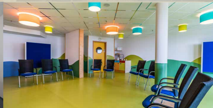
Tagungsraum „Victory Island“ max. 62 Pers. / 66,27 m 2