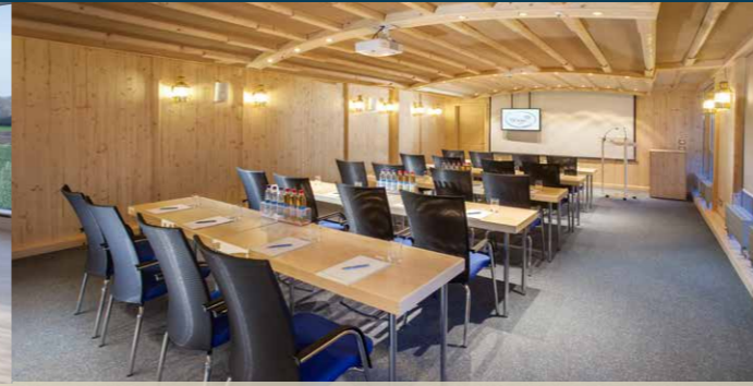
Tagungsraum „Vollschiff“ max. 60 Pers. / 72,3 m 2