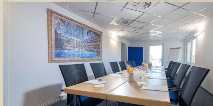
Tagungsraum „Schoner“ max. 25 Pers. / 35,1 m 2