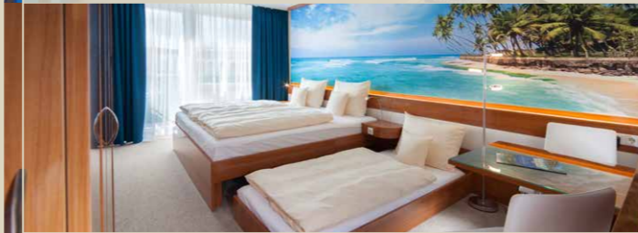
Apartment im VICTORY GÄSTEHAUS (26 m 2 )