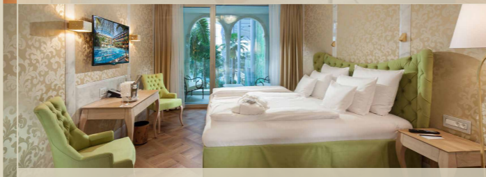
Serenissima Zimmer im HOTEL VICTORY (29 m 2 )