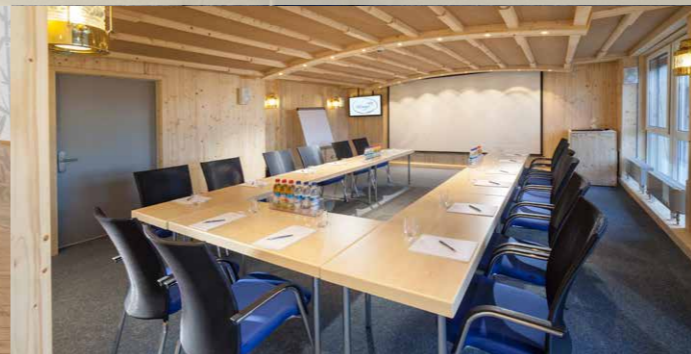
Tagungsraum „Bark“ max. 30 Pers. / 43,9 m 2