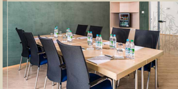
Tagungsraum „Kogge“ max. 25 Pers. / 35,1 m 2