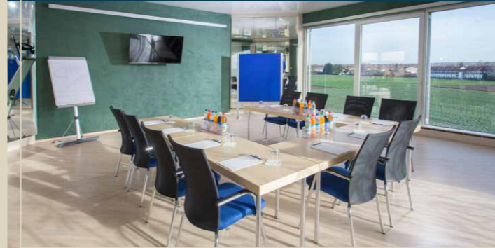
Tagungsraum „Panorama“ max. 30 Pers. / 58,8 m 2

6 Tagungsräume bieten Platz für neue Ideen, kreatives Denken und Gespräche. Die Räume sind ruhig gelegen und abseits vom Badebetrieb der THERME ERDING.